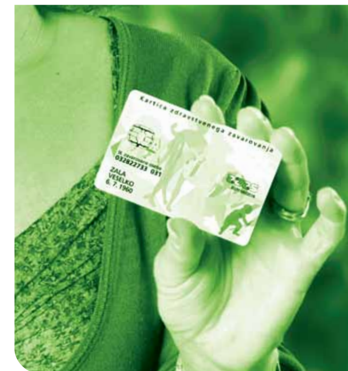
Kiadó: Szlovén Egészségbiztosítási Intézet, Miklošičeva cesta 24, Ljubljana. Grafikai tervezés: Imago, d. o. o., nyomda: Tiskarna Grafex, d. o. o., Ljubljana, 2015. Június.