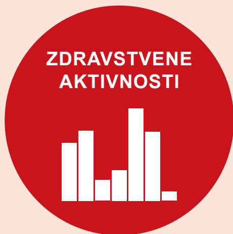
Tabela 3. Izbrani kazalniki o zdravstvenih aktivnostih v Sloveniji in primerjava s povprečji EU 14 ter sosednjimi državami v letu 2018.