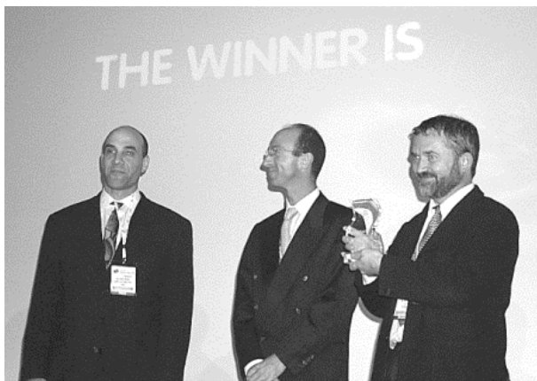
Slika 2. Za edinstveno rešitev, kakršna je bila uvedba elektronske kartice na nacionalnem nivoju, je ZZZS prejel nagrado na svetovnem sejmu in razstavi za kartično tehnologijo Cartes, leta 2000 v Parizu.

Uvedba sistema kartice je leta 2000 na mednarodnem forumu za kartične tehnologije in njihovo uporabo – Cartec 2000 v Parizu prejela prvo nagrado za najboljši projekt leta 2000 na področju kartične tehnologije z utemeljitvijo, da s tem v slovensko zdravstvo ne uvajamo zgolj sodobnega, elektronsko berljivega dokumenta temveč tudi elektronsko omrežje, v katero so povezani vsi izvajalci zdravstvenih storitev ter omrežje samopostrežnih terminalov, ki ni namenjeno zgolj potrjevanju kartic zdravstvenega zavarovanja temveč tudi celovitemu informiranju in servisiranju zavarovanih oseb.